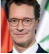
Hendrik Wüst Ministerpräsident des Landes Nordrhein-Westfalen Schirmherr

Im vergangenen Jahr haben die FilmSchauPlätze NRW ein wirklich stolzes Jubiläum gefeiert: Seit 25 Jahren touren sie kreuz und quer durch unser Land und zeigen an vielen wunderschönen Orten zwischen Rhein und Weser ebenso unterhaltsame wie spannende Filme. Vom Klassiker bis zum Hollywood-Blockbuster ist alles dabei. Und auch in diesem Sommer kehren die FilmSchauPlätze NRW mit einem tollen Programm zurück auf die Leinwand.